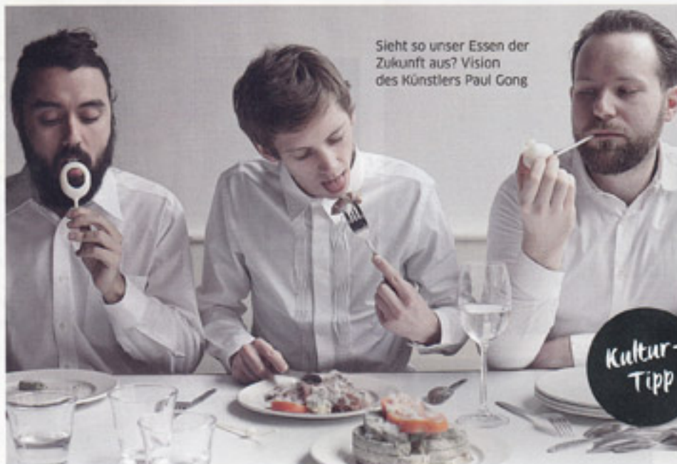
Sieht so unser Essen der Zukunft aus? Vision des Künstlers Paul Gong

— Wie werden wir in Zukunft essen? Wie das Problem der Nahrungsmittelknappheit lösen? Und wie Lebensmittel umweltschonender produzieren? Um diese Fragen dreht sich die Ausstellung „Food Revolution 5.0“ im Hamburger Museum für Kunst und Gewerbe. Sie wirft einen kritischen Blick auf die aktuelle Produktion von Nahrung und zeigt Visionen von Wissenschaftlern sowie Architekten auf. Spannend, inspirierend, zum Nachdenken anregend. Vom 19. Mai bis 29. Oktober. www.mkg-hamburg.de