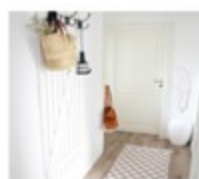
FLUR UND TREPPENHAUS NEU GESTALTEN VORHER NACHHER