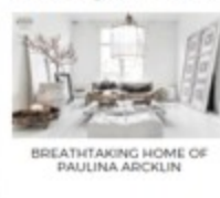
BREATHTAKING HOME OF PAULINA ARCKLIN