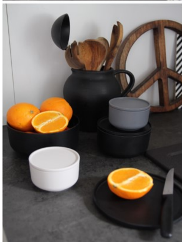
Ein Wandregal dekorieren: so wird's gemacht!